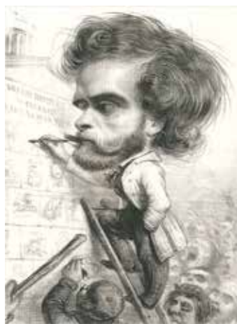
Le Panthéon charivarique d'Hector Berlioz