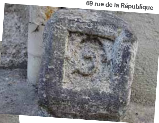
69 rue de la République

plusieurs bornes sur le territoire communal, merci d'en informer le service Archives de la mairie (04 74 20 53 99).