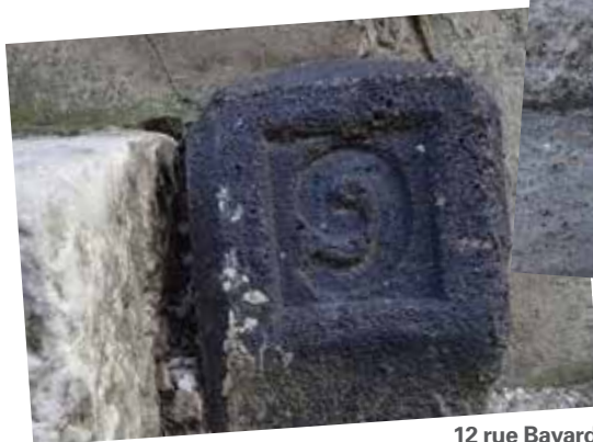
12 rue Bayard

palette de couleurs devant servir de référence et d'outil de travail au service instructeur et au comité de pilotage en charge de l'étude des dossiers. Renseignements complémentaires (travaux éligibles, dépôt des dossiers d'aide) : service Urbanisme de la ville (04 74 20 53 99).