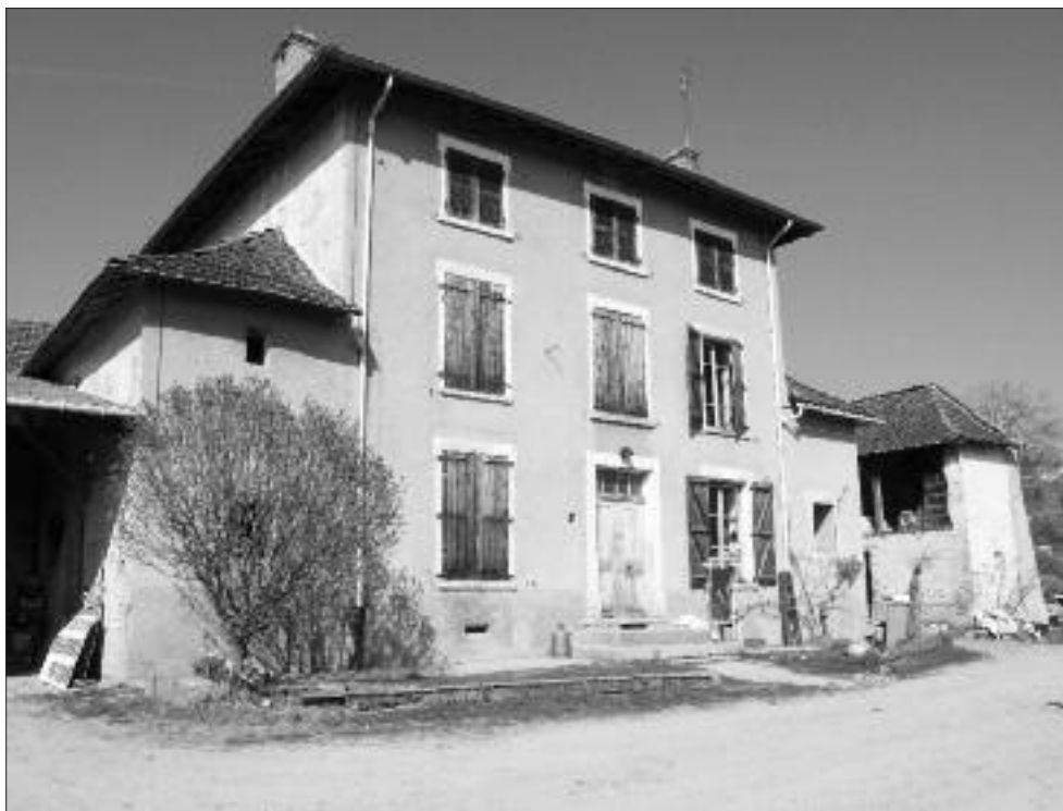
Ferme de la Mure

L'aménagement des Bains douches où seraient créées 30 places de parking payant avec abonnement à l'année pour ceux qui viennent travailler à la Côte St André. Ces 30 places libéreront autant de places pour les autres usagers, habitants ou clients.